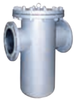
90型单筒过管道滤器