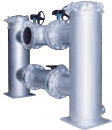
950B 型双筒偏置管道过滤器