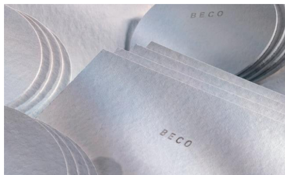
Portata d'acqua gamma BECO standard

BECO SD 30, KDS 15, KDS 12, KD 10, KD 7, KD 5 Strati filtranti di profondità BECO, ideali per raggiungere un elevato grado di limpidezza. Trattengono le particelle più fini in modo sicuro ed hanno un apprezzabile effetto di riduzione della carica microbica. Particolarmente adatti per la conservazione e l'imbottigliamento di liquidi limpidi.