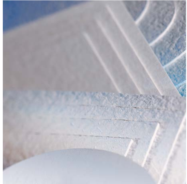
Permeabilidad al agua gama BECO PR

Placas de filtración en profundidad BECO para obtener un alto grado de clarificación. Estas placas de filtración en profundidad retienen de forma fiable las partículas más finas y reducen los gérmenes.